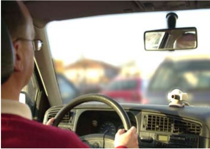
Detektion des Lidschlags für Fahrerassistenzsysteme