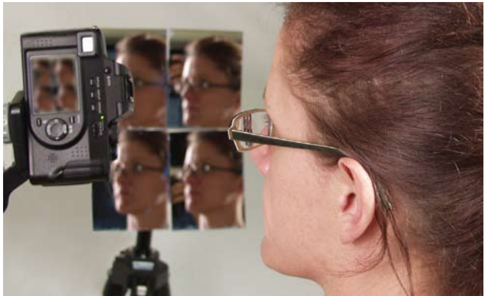
Aufnahmeverfahren mit 4 Spiegeln

Die Rekonstruktion von 3D-Modellen erfolgt auf der Basis zweidimensionaler Einzelbilder von Objekten. Für die Aufnahmen sind zwei Verfahren vorgesehen: