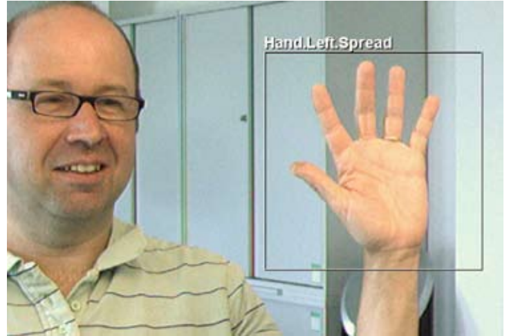
Handerkennung und Bewegungsdetektion für die Cursor-Steuerung ohne Tastatur und Maus