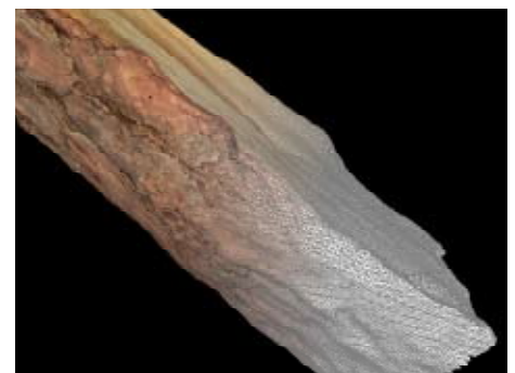
Texturbeispiel für die schnelle 3D-Modell-Generierung von Objekten