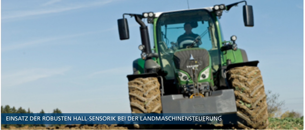
EINSATZ DER ROBUSTEN HALL-SENSORIK BEI DER LANDMASCHINENSTEUERUNG

Wettereinflüsse, Temperaturschwankungen, Störfelder. All diesen Problemen müssen insbesondere Baumaschinen täglich trotzen. Das Fraunhofer IIS hat hierfür die passende Lösung entwickelt – die HallinOne®-Magnetfeldsensorik. Sie ist in einen berührungslosen, fremdfeldunabhängigen Sensor im Joystick integriert und ermöglicht so eine sehr robuste und langlebige Steuerung von Baumaschinen. Da das System nicht die Magnetfeldstärke misst, sondern eine Winkelauswertung der Feldlinien durchführt, sorgt diese Lösung für gleichbleibende Ergebnisse bei veränderlichen Temperaturen. Der Joystick erfüllt zudem die SIL2-Sicherheitsanforderungen. Entwickelt wurde er in Zusammenarbeit mit der Firma DeltaTech Controls aus Berlin.